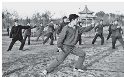
20世纪80年代初榆林县莲花池群众太极拳晨练

1985年地区体委在县委、县政府机关和较大企事业单位重点推动职工体育，极大地带动了全区职工体育的开展。全区有90%的县委和政府机关坚持做广播操和开展节假日活动；职工参加各种体育活动的人数、职工体育人口不断增加；体育卫生保健讲座大受欢迎；大、小型群众体育竞赛丰富多彩；职工体育逐级检查、层层评比，通过授予职工体育先进地区、先进县、成绩显著县、先进集体、先进个人等荣誉称号，鼓