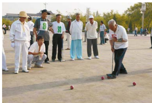
全市老年门球比赛

地区老年体协成立之初，工作重心放在了宣传、组建机构、发展会员等方面，在城市组织以离退休干部为主的老年人体育活动，重点做好铺摊子、搭架子的奠基工作。