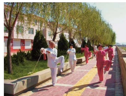
绥德市民在公园健身

因为组织有序，活动丰富多样，参与面广，榆林市体育局被国家体育总局评为全国“全民健身周”优秀组织单位，市中级人民法院被评为全国“全民健身周”先进单位，