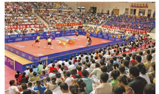
2009年全国乒超联赛在榆林举行

为了让榆林的乒乓球爱好者能够近距离接触乒乓球奥运冠军，经中国乒协批准，2009年6月20日至7月25日，榆林承办了榆天化“2009年361°中国乒乓球俱乐部超级联赛”女子八一长安和山东鲁能乒乓球俱乐部队，男子宁波北仑海天和上海明园金海洋集团的竞赛。王励勤、李晓霞、马龙等奥运冠军成员来榆林参赛。此次竞赛激发了榆林地区人民群众参加乒乓球的热情。