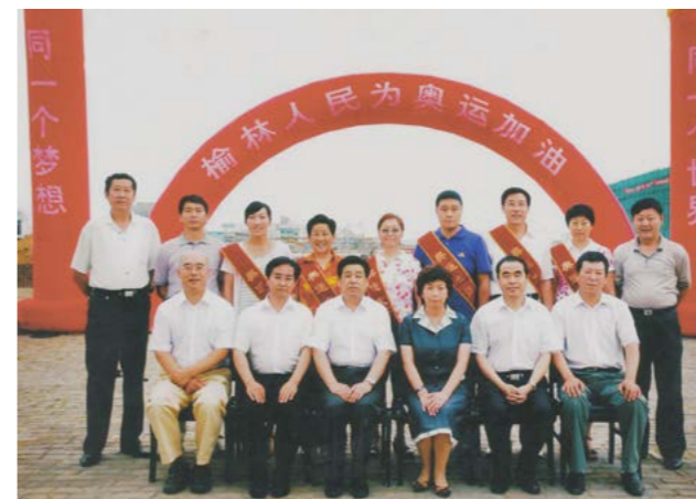
2008年榆林市奥运火炬手赴延安、杨凌、西安参加火炬传递

2003年“非典”时期，全市对于体育和健康的宣传，深入人心，为提高群众参与体育的自觉性起到了积极的作用。农民体育健身工程的稳步实施，把体育场地建到了农民身边，提供了最基本的健身条件，为农村体育组织的建立健全和活动的开展提供了平台，有效地推进了农村全民健身公共服务体系的建设，使广大农民能够享受到基本的公共体育服务。社会体育组织和社会体育指导员的增多，使得社区能够开展形式