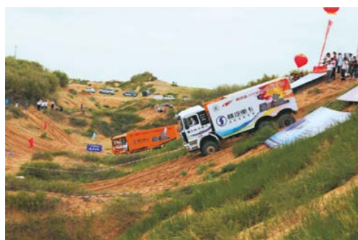
2009年全国超级卡车大赛在榆林毛乌素沙漠举行