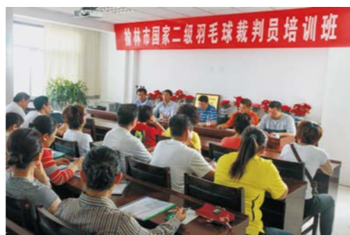
榆林市国家二级羽毛球裁判员培训班

这些竞赛活动提高了榆林市的知名度，打造了古城新形象，推动了全民健身运动的深入开展。