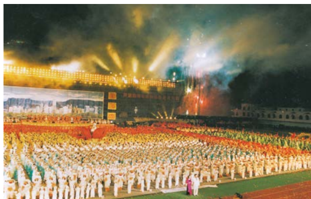
2003年陕西省第五届农民运动会在榆林神木举行

多样的体育活动。北京奥运会的成功举办、全民健身日的设立，强化了群众对于体育的认识，唤醒了群众参与体育的意识。